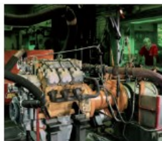
10. Testy na hamowni