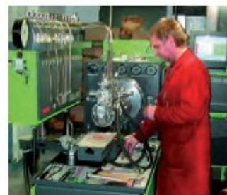
7. Kontrola pomp