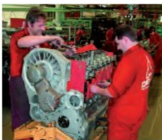
9. Montaż na taśmie produkcyjnej