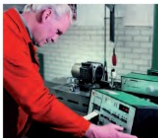
6. Kontrola jakości części