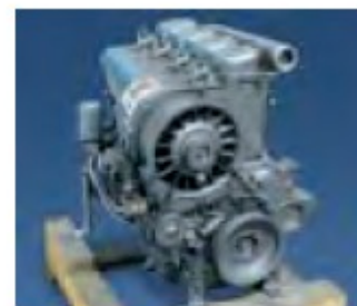
11. Wysyłka do klienta