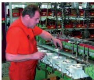
8. Montaż podzespołów